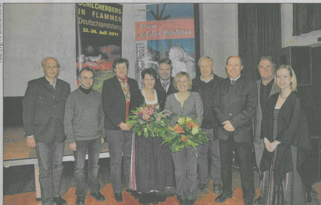
Der Vorstand des Tourismusverbandes Schilcherheimat blickt voller Optimismus in die Zukunft

Für das laufende Jahr werden Schwerpunkte auf bestens etablierte Großveranstaltungen wie „Schilcherberg in Flammen“, „Weltradsportwoche“, „City Duathlon“ oder das Herbstfest „Sturm auf den Schilcher“ gelegt. Natürlich werden auch weitere Veranstaltungen vom Tourismusverband Schilcherheimat, dessen Budget immerhin 376.000 Euro beträgt, laufend unterstützt.