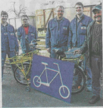
Rad und Tat beim Flascherzug. KK