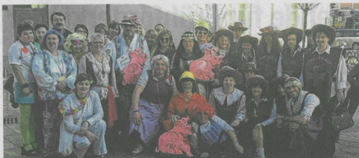
Maskenprämierung am Faschingdienstag durch den FC Sauzipf. AR