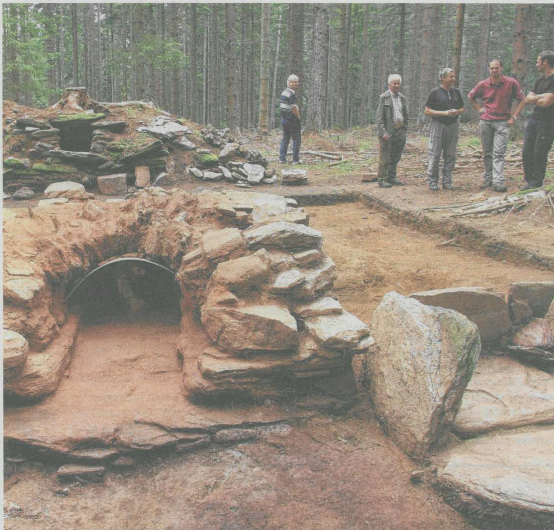
Kühlofen, Glasofen und Strecköfen sollen künftig nicht nur für Historiker zu besichtigen sein