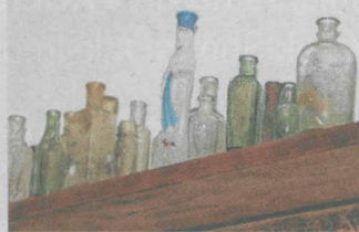
Originale Flaschen LASUTSCHENKO