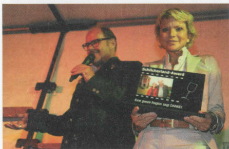
Der Dank der Region an Uschi Glas & August Schmölzer

August Schmölzer hat ja lange für diesen rund 1,7 Millionen teuren Film gekämpft und nun ist das Werk vollendet