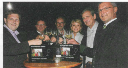
Sie stoßen auf ihren Erfolg an