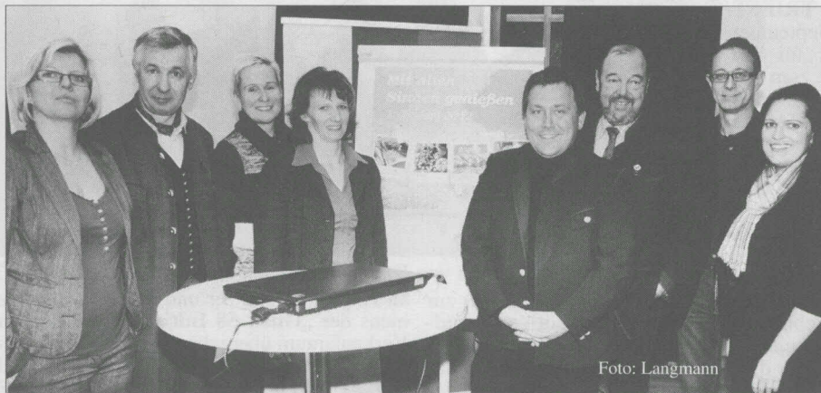
Breit aufgestellte Organisationsstruktur als Garant zum Erfolg.

chern ins niederösterreichische Horn. Seit 1996 besteht der Verband, er ist Mitglied in der World Barbecue Association, der 1999 die ersten Weltmeisterschaften im Grillen ausgerichtet hat.